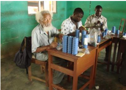
SOLUX vous aide à la mise en place de votre atelier

Avec une SOLUX-LED, vous n'avez plus besoin d'acheter des piles, du kérosène ou des bougies. Au niveau local, les ateliers SOLUX encouragent les initiatives économiques et font progresser les compétences techniques.